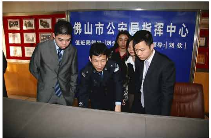
本局代表團到佛山公安局交流

No dia 29 de Dezembro, uma delegação chefiada pelo Comandante da “Police Tactical Unit of Hong Kong Force”, Chief Superintendent Wong Chi-hong, efectuou uma visita à Corporação, no intuito de efectuar um estudo sobre as tarefas de segurança dos Jogos da Ásia Oriental.