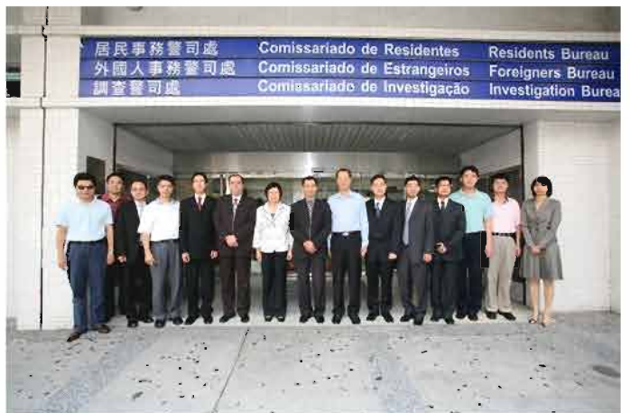
代表團到本局出入境事務廳進行業務交流