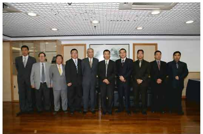
澳門日報讀者公益基金會一行到訪本局