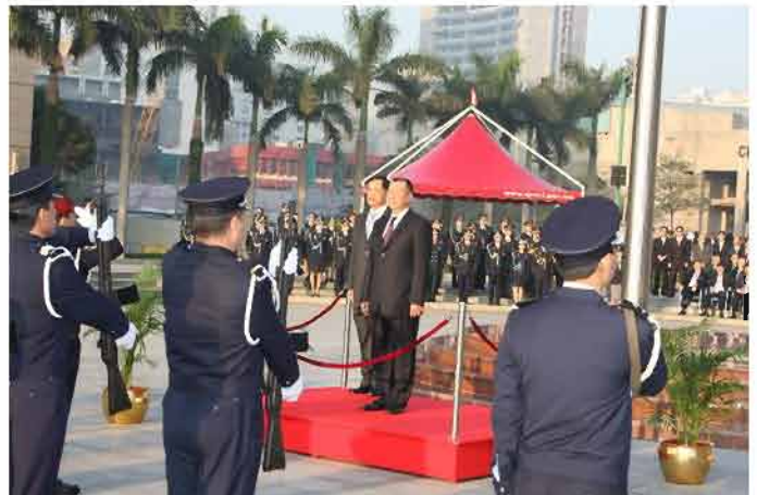
行政長官接受儀仗隊敬禮