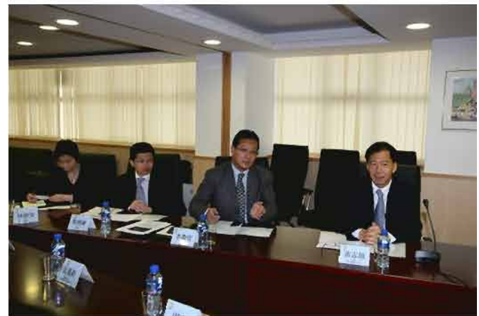
香港警務處代表到本局交流安保工作經驗