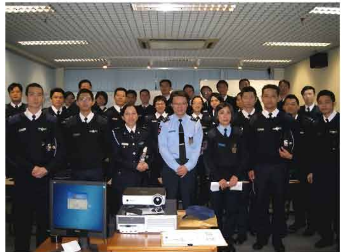
海關人員到本局參觀