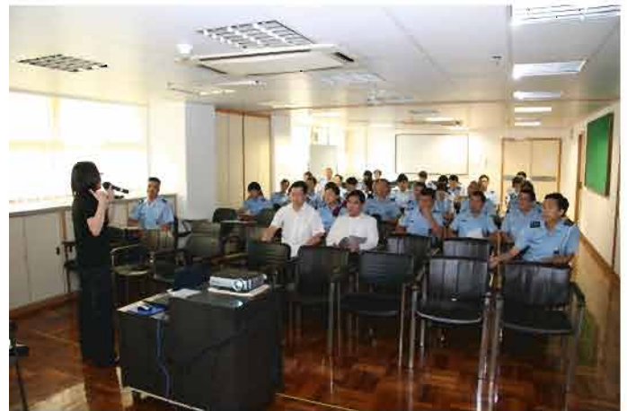
臨床心理學家為本局人員進行專業培訓課程

10月28至31日，本局邀請了社會工作局的臨床心理學家，為120名人員進行了有關“人口販賣受害者及性侵犯受虐者的心理狀態及處理講座”之培訓課程，藉以增強本局人員與受害者之間的溝通技巧。另外，在11月25日，17名警官參與由善牧中心與婦女事務諮詢委員會所舉辦的關注人口販賣及剝削勞動研討會，藉以瞭解外地相關機構在處理有關事宜方面的工作經驗。