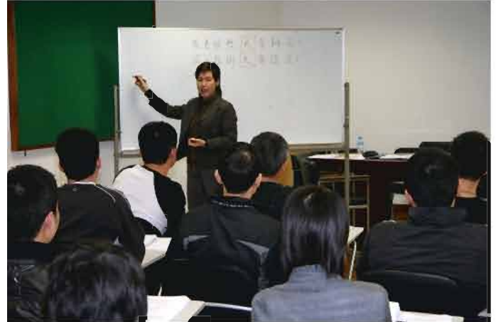
課程導師向警員傳授優化工作的要訣

Também, em cooperação com a Direcção dos Serviços da Administração e Função Pública (SAFP), o CPSP juntou outras três turmas para a frequência do “Curso de Atendimento e Tratamento de Queixas”, que teve lugar durante os meses de Dezembro de 2008 e Janeiro deste ano. O conteúdo do curso está relacionado com o aprofundamento e reforço das técnicas de atendimento e de tratamento de queixas, técnicas de comunicação, relações humanas e o espírito de obrigação de servidor público, face ao género de tarefas que cabem a esta Corporação. Esta acção de formação foi de 16 horas, ministrada em dois dias e contou com a participação de 25 agentes em cada turma.