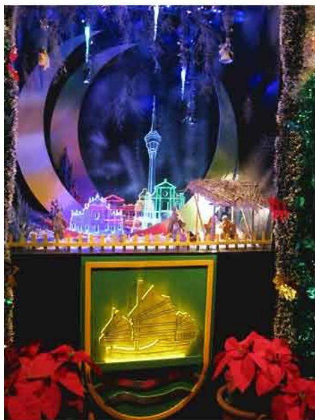
氹仔警務警司處藉著獨特的設計奪獎

在表演舞臺上，警察樂隊演奏了多首悅耳的應節歌曲，舞蹈組以優美的舞姿贏得了全場熱烈掌聲。澳門人樂隊及本澳著名歌手演唱了多首耳熟能詳的中西歌曲，還有時下熱興的瑜伽表演。壓軸是獎品豐富的大抽獎，場內氣氛最熾熱的時刻，中獎的幸運兒臉上都流露著滿心的喜悅，本年度的聖誕聯歡就在一片歡樂聲中圓滿地結束。