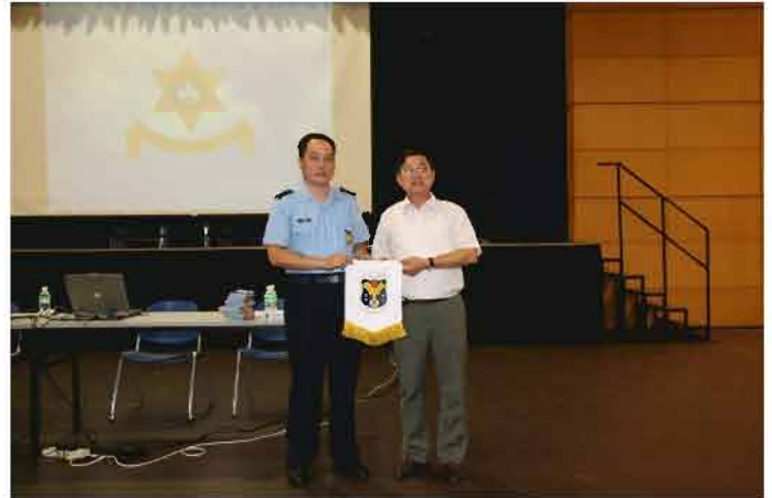
本局人員積極地到各中、小學進行預防青少年犯罪講座

Por outro lado, na tarde do dia 1 de Novembro, realizou-se na Praça do Tap Seac, as cerimónias de abertura das actividades denominadas “Carnaval da Segurança Rodoviária” e “Campanha de Sensibilização Rodoviária”, organizadas em conjunto pela Direcção dos Serviços para os Assuntos de Tráfego (DSAT) e pelo CPSP. O tema desta actividade foi designado “Para uma cidade segura e saudável, a segurança rodoviária é indispensável”, esperando-se que através destas mensagens se possam transmitir informações aos cidadãos sobre segurança rodoviária, para que juntos construamos um ambiente de circulação rodoviária seguro, cumpridor da lei e com respeito por todos os utilizadores das vias públicas.