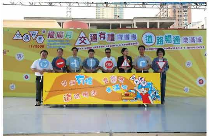
交通安全嘉年華活動在塔石廣場舉行