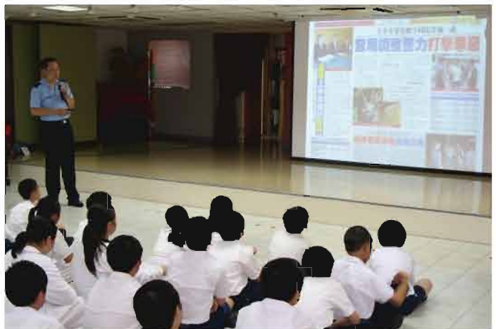
本局人員積極地到各中、小學進行預防青少年犯罪講座